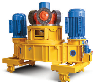
M2 - 130