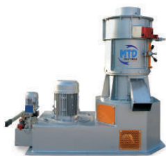
M1 - 40