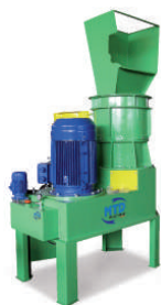
M1 - 60