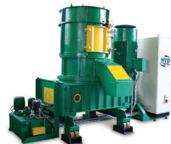
M1 - 100