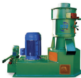
M1 - 80