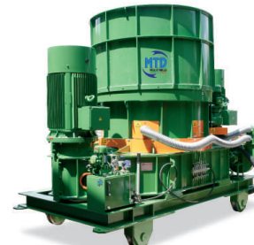
M2 - 170